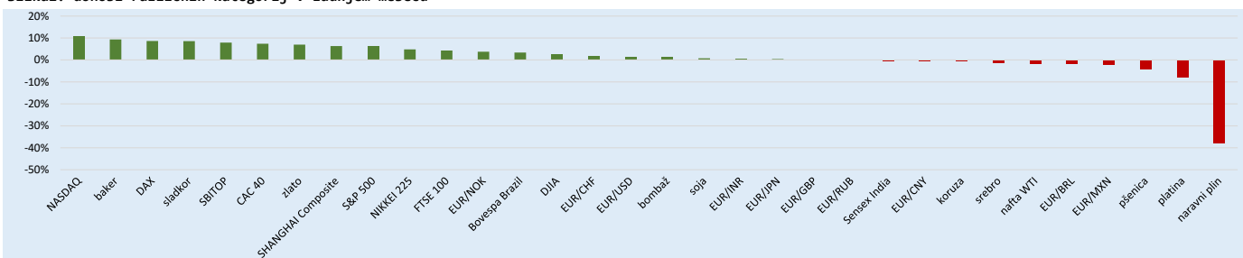
Tabela1: donosi izbranih borznih indeksov